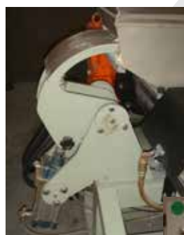
Pilón Duplo Exclusivo